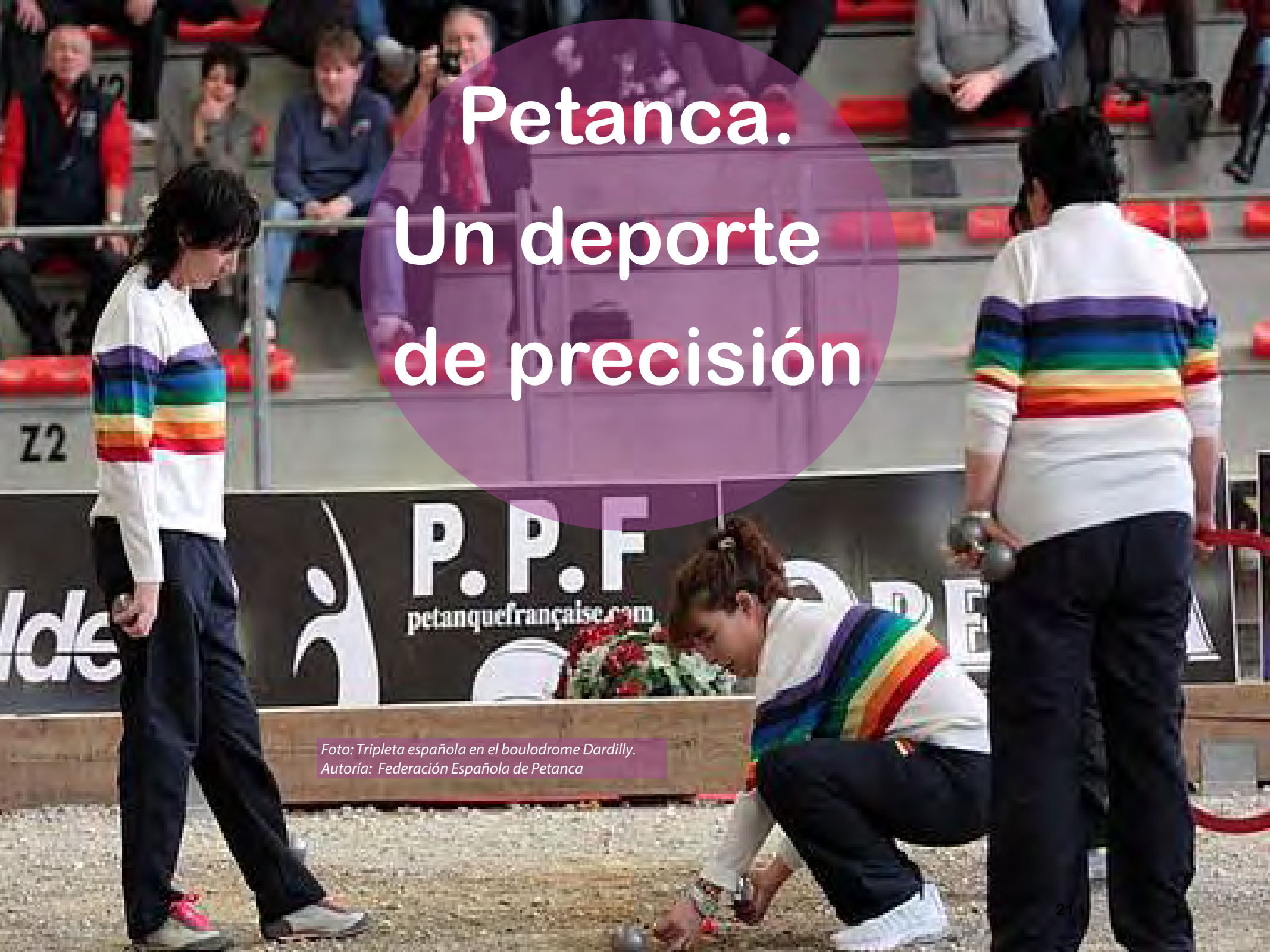
Foto: Tripleta española en el boulodrome Dardilly. Autoría: Federación Española de Petanca