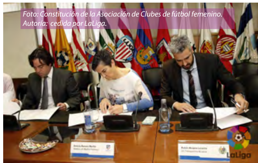
Foto: Constitución de la Asociación de Clubes de fútbol femenino.

Para la vicepresidenta de la Asociación de Clubes Femeninos esta situación cambiará “cuando las mujeres vean un futuro. El cambio llegará cuando vean que pueden vivir de entrenar, de jugar, de estar en los despachos. Ahora mismo no es una cuestión de sexo. Ellos están más preparados porque llevan más tiempo. Hay una generación de jugadoras que se están formando para ser entrenadoras, que están consiguiendo el Nivel 3, que