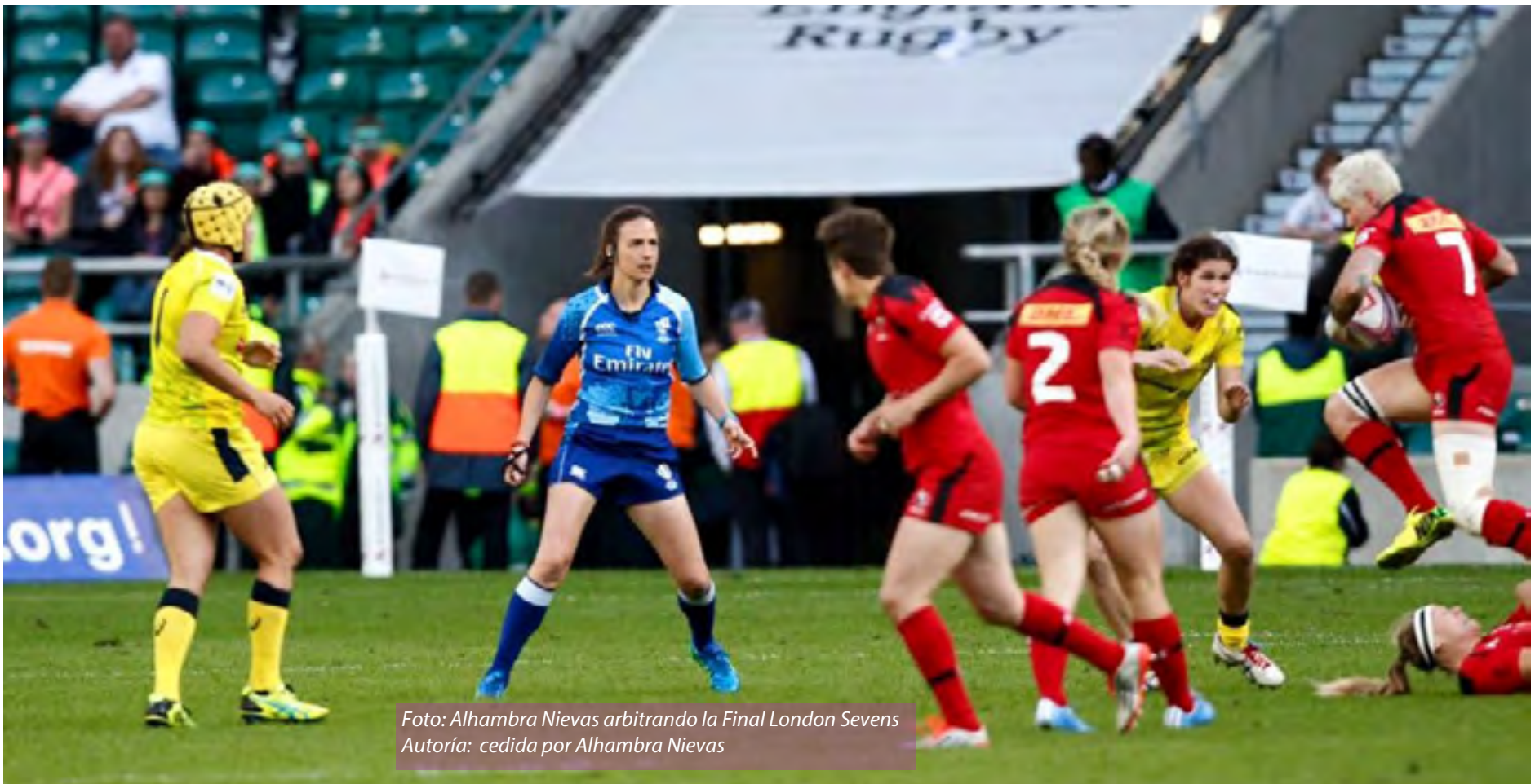
Foto: Alhambra Nieves arbitrando la Final London Sevens