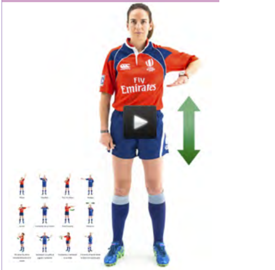
imagen del nuevo reglamento de Rugby. Pincha en la imagen para ir a la web.