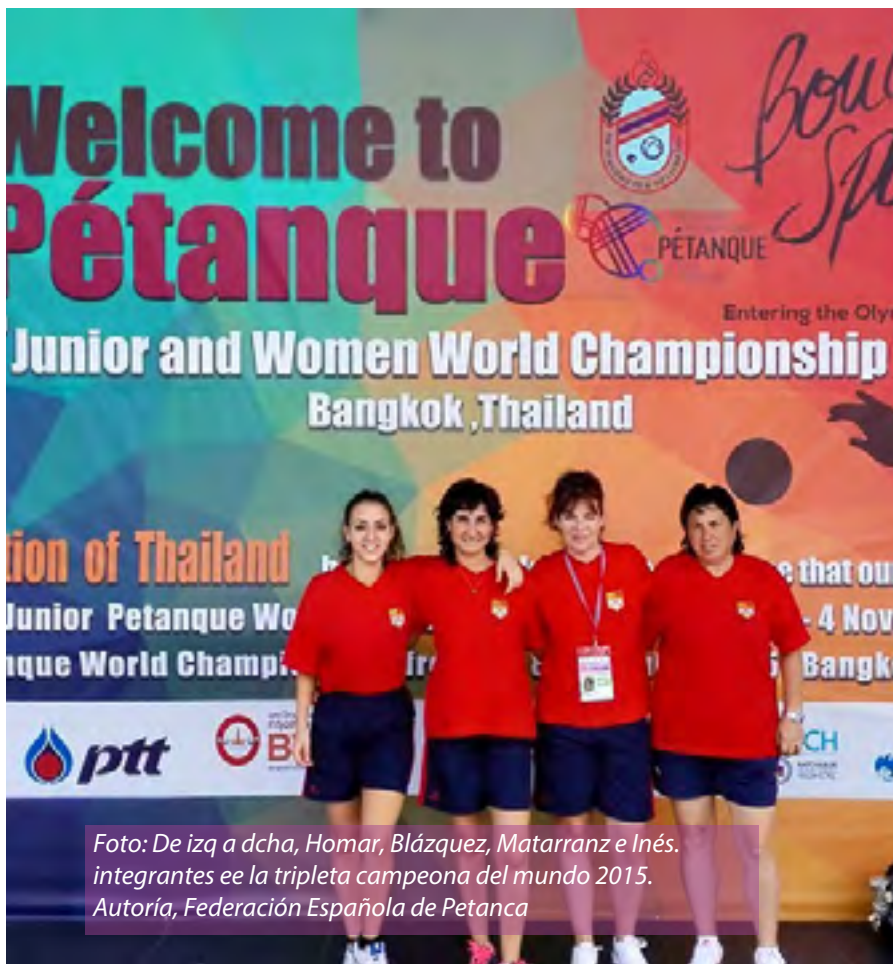
Foto: De izq a dcha, Homar, Blázquez, Matarranz e Inés. integrantes ee la tripleta campeona del mundo 2015.

pistas abiertas y se hacen “melés”, un sorteo de todos los jugadores, hombres y mujeres, por parejas para ir haciendo partidas”, explica Blázquez .