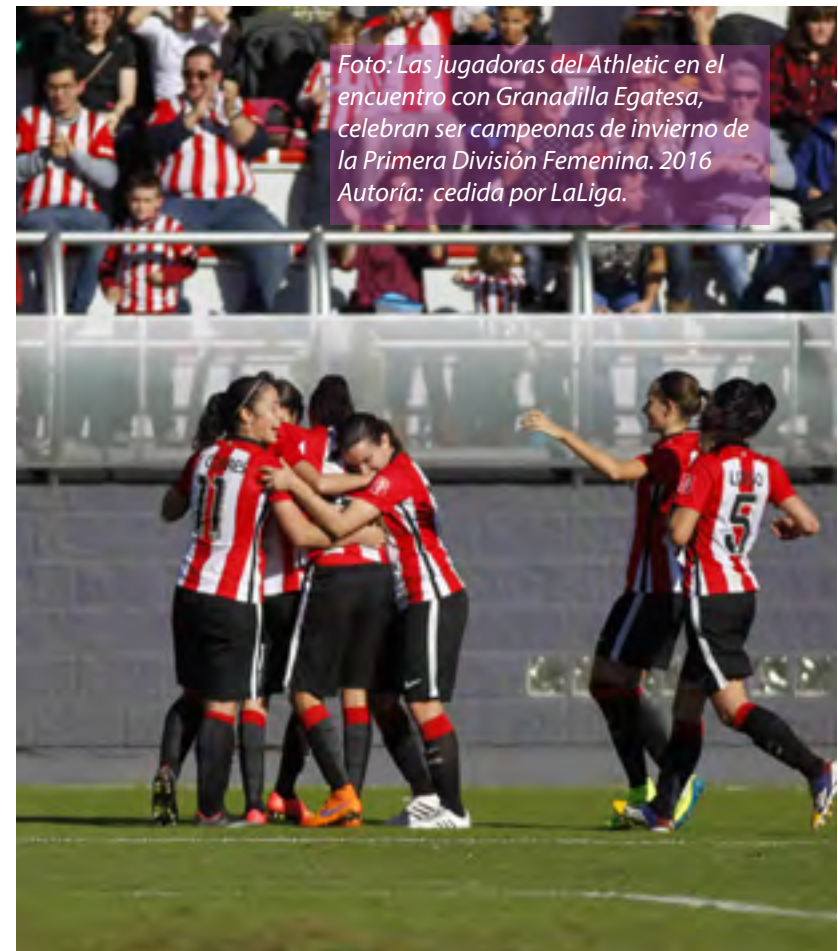
Foto: Las jugadoras del Athletic en el encuentro con Granadilla Egatesa, celebran ser campeonas de invierno de la Primera División Femenina. 2016

Profesionalizar el fútbol femenino es, sin duda, uno de los grandes objetivos y retos de este deporte pero, para ello, debemos trazar una adecuada estrategia que permita ir asentando unas bases sólidas. El fútbol femenino debe ser capaz de consolidarse como un producto atractivo y capaz de generar recursos propios, atraer interés del público, de las marcas comerciales, de la televisión, etc. Si todos, instituciones, clubes, jugadoras, sociedad, etc. avanzamos en la misma línea, dentro de unos años podremos hablar de una competición profesional femenina de alto nivel y calidad.