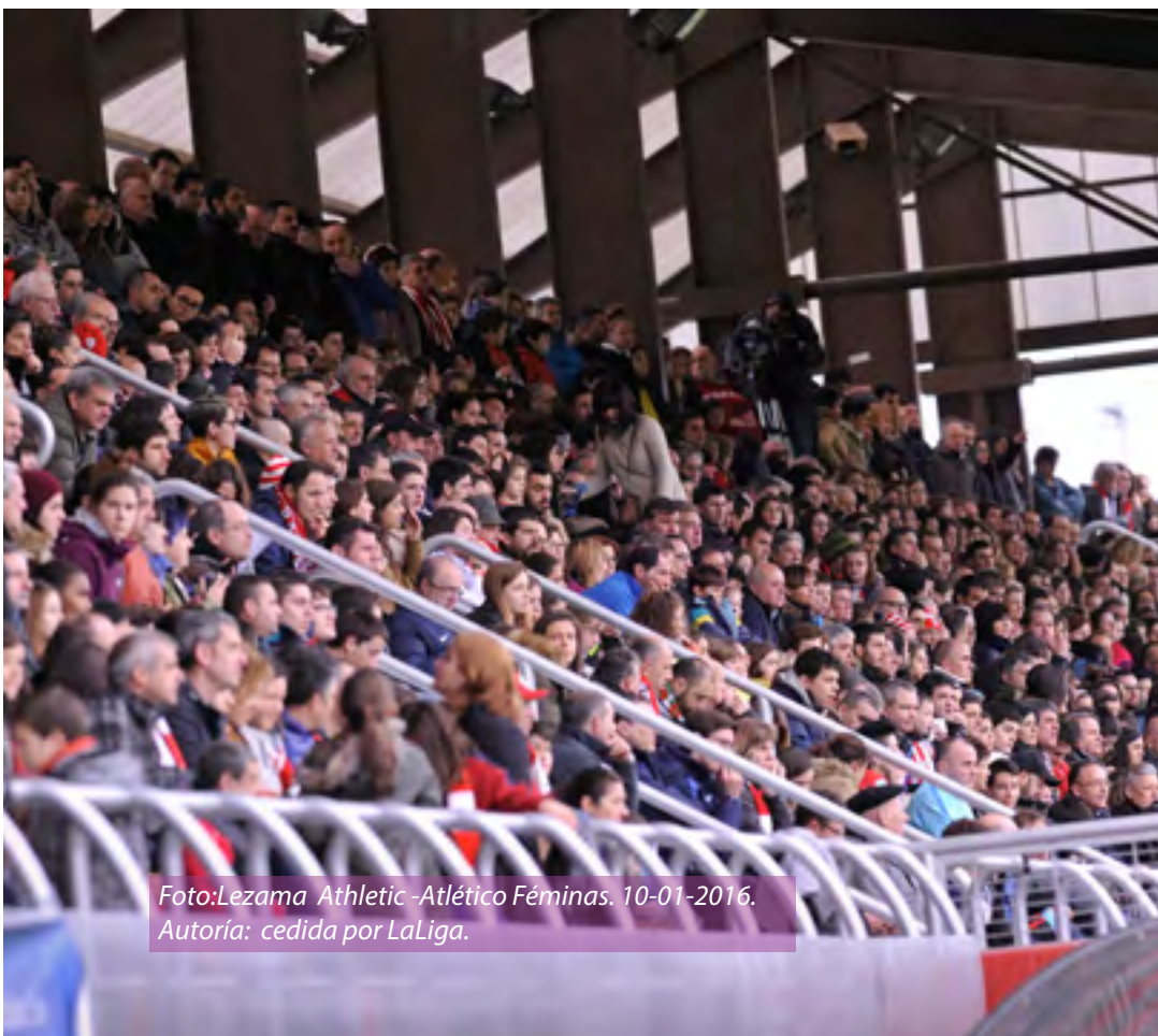
Foto:Lezama Athletic -Atlético Féminas. 10-01-2016.

han vivido el fútbol y saben dirigir una plantilla. El problema es que nunca hemos tenido un respaldo para que se creyesen que podíamos tener un futuro de trabajo. Que se nos valore, que se nos reconozca nos va a dar futuro y pronto veremos a más entrenadoras en los banquillos”.