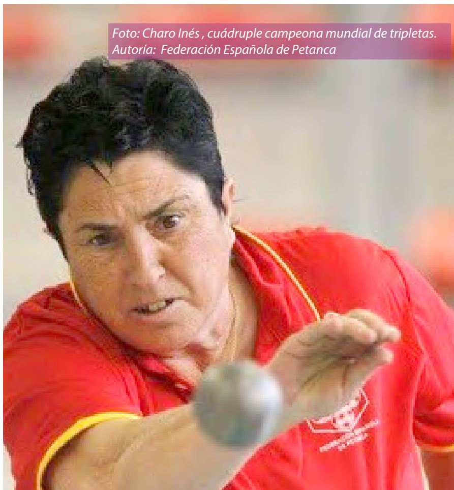
Foto: Charo Inés , cuádruple campeona mundial de tripletas.

avía estoy de pie y jugando, pero los dolores siguen. Después de cuatro o cinco partidas lo notas, pero seguiré hasta que aguante y tengo la suerte de que juego con unas compañeras excepcionales y en los momentos flacos estuvieron ahí”.