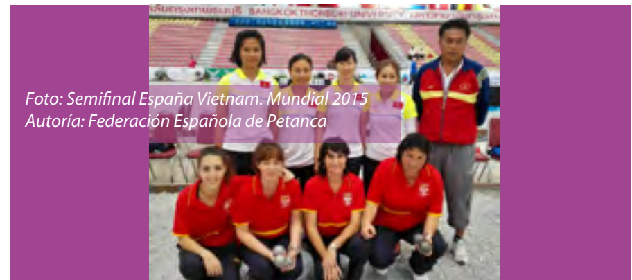
Foto: Semifinal España Vietnam. Mundial 2015