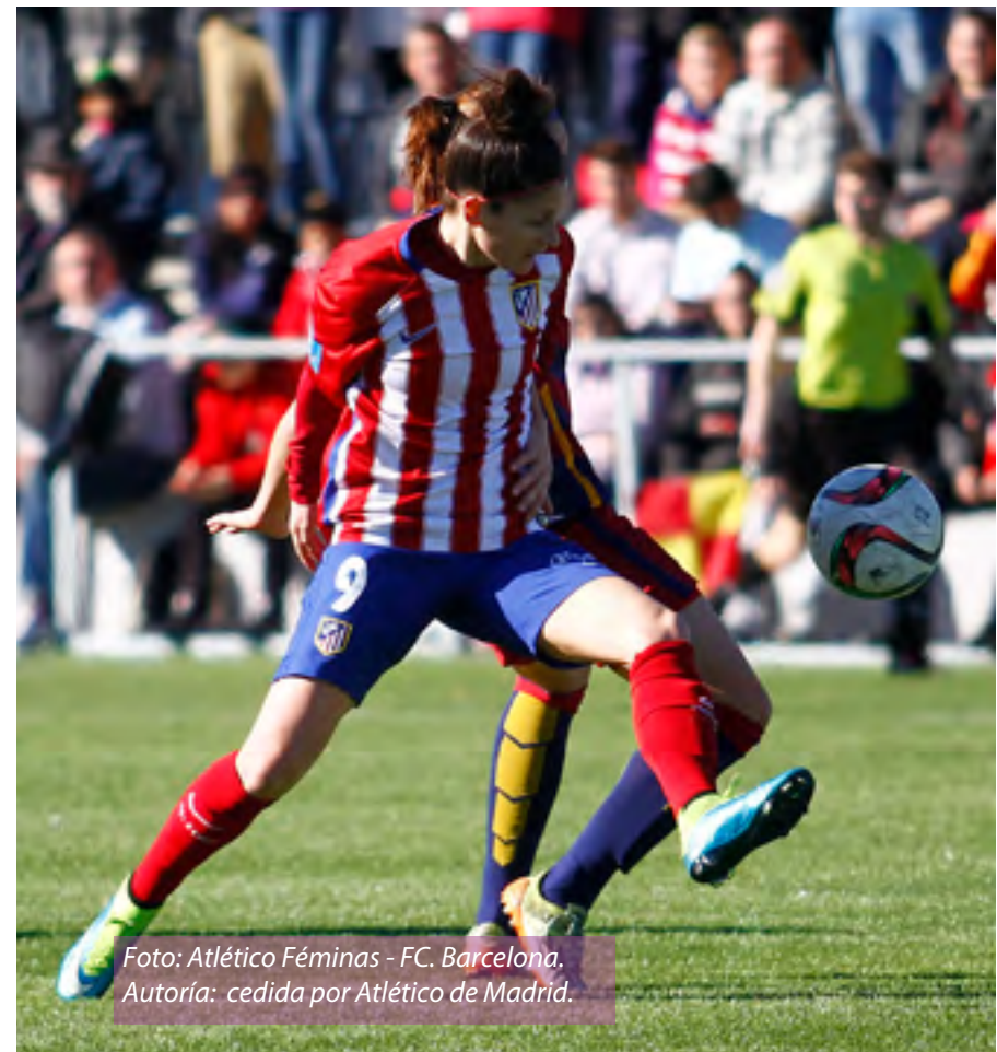
Foto: Atlético Féminas - FC. Barcelona.

Una pelea que se dirime ahora mismo entre equipos que se integran en clubes profesionales. Los seis primeros clasificados son secciones de equipos de la Liga BBVA, como es el caso del Atlético de Madrid. Ser una sec-