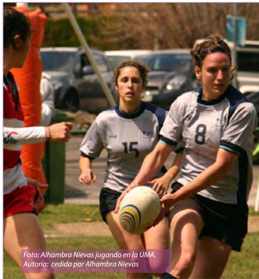
Foto: Alhambra Nuevas jugando en la UMA.

Habitualmente dirige partidos de la liga masculina de División de Honor en España, aunque una buena parte de la temporada se encuentra arbi-