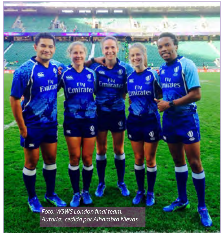
Foto: WSWS London final team. Autoría: cedida por Alhambra Nieves